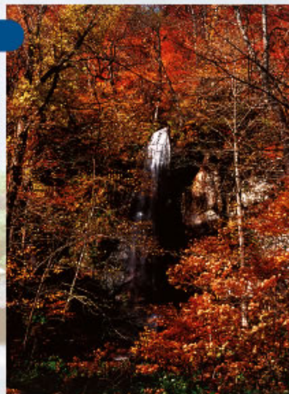
まんりょう 万両の流れ

いく筋もの筋になって流れ落ちる滝は、絹糸のように繊細で風に揺らぐその姿は、まるで乙女のようなようです。