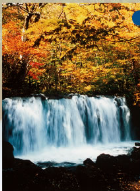
ちょうしおおたき 銚子大滝

幅20m、高さ7m、見事な水量を誇るこの滝は奥入瀬川本流にかかる唯一の滝で、奥入瀬を遡上して十和田湖に入ろうとする魚を拒む、魚止めめの滝でした。勇壮で見事な様子は今もなお十和田湖の神秘を守る番人のようです。