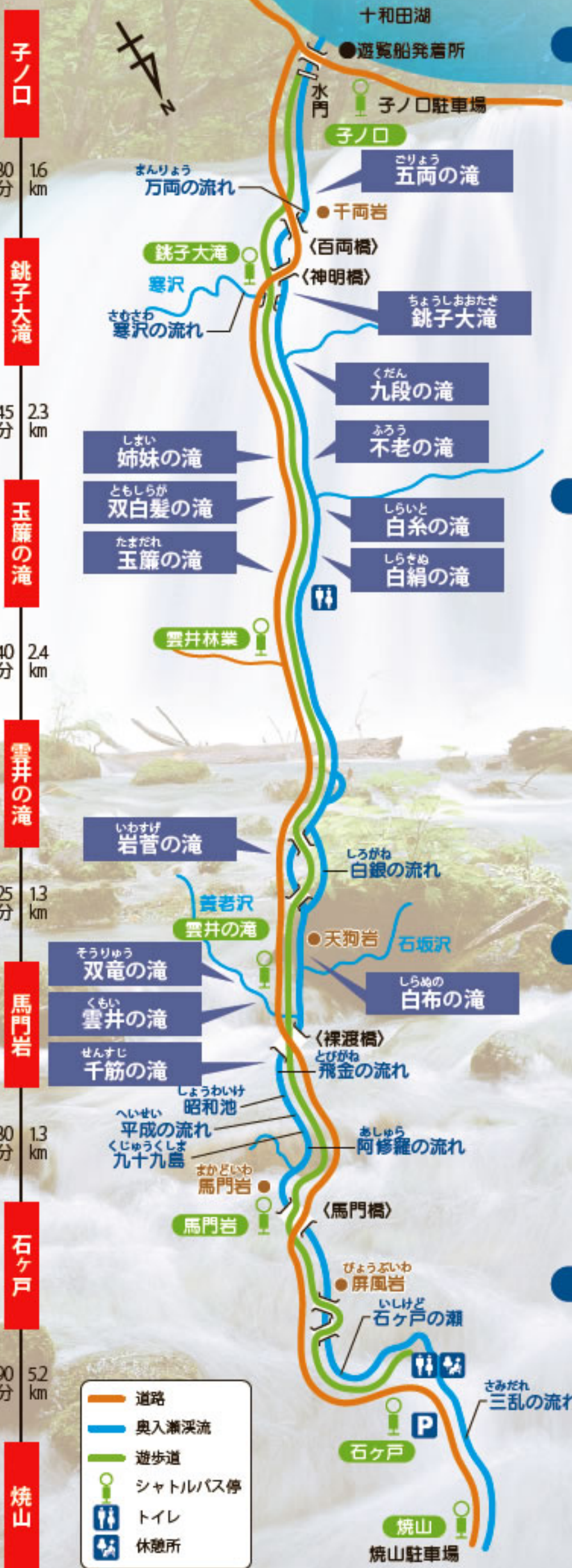
ともしらが 双白髪の滝

奥入瀬溪流の流れの上に顔を出す島々は、苔や草木を身にまとい、庭園のような美しさです。