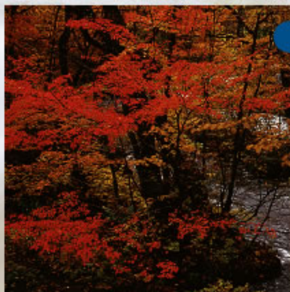
くじゅうくしま 九十九島

十和田湖の入り口を塞ぐようにそびえる馬門岩は、十和田湖の表門にふさわしい見事な巨岩です。