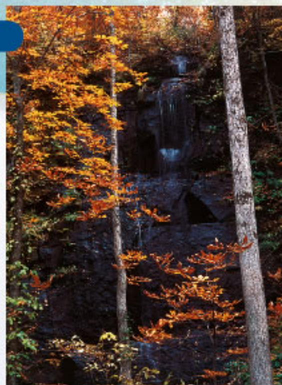
しらいと 白糸の滝

冬、見事な氷柱を造るこの滝は、いつまでも尽きることのない、永遠の命を感じさせます。